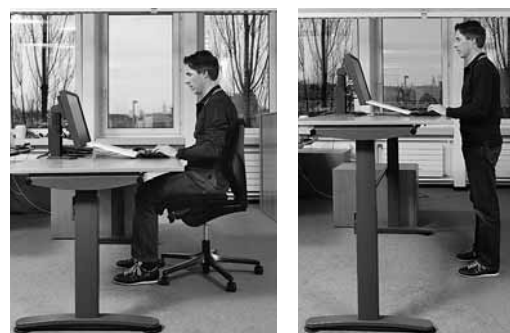
Fig. 6: scrivania regolabile elettricamente che consente di lavorare sia in piedi che seduti.