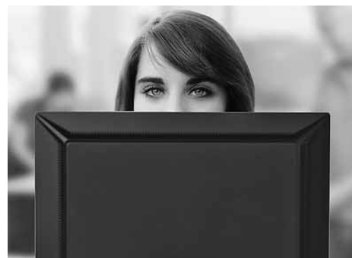
Fig. 4: dovete poter vedere al di sopra dello schermo!