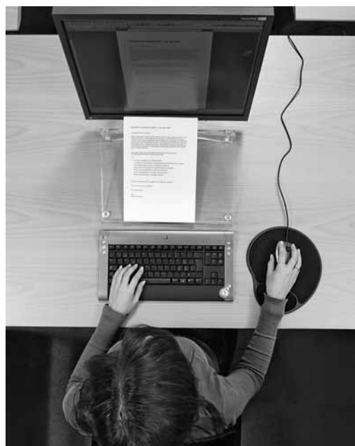
Fig. 3: i documenti di lavoro sono posizionati tra la tastiera e lo schermo.