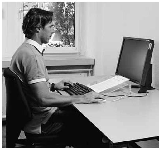
Fig. 1: posizione corretta dello schermo (illuminazione laterale).